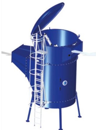
Leiter mit Laufbühne DS