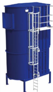
Leiter mit Laufbühne, seitenmontiert SBF