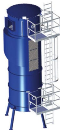
Leiter mit doppelter zusätzlichen Laufbühne BF