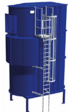
Leiter mit Laufbühne, frontmontiert SB