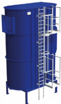
Leiter mit Laufbühne SBF