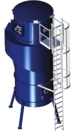
Leiter mit Laufbühne, frontmontiert BF